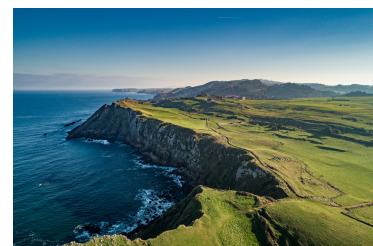
Küsten (z.B. zum Atlantik)