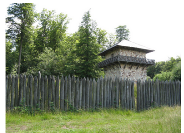
Limes (z.B. in Deutschland)