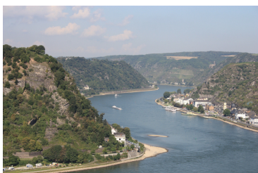
Flüsse (z.B. Rhein, Donau)