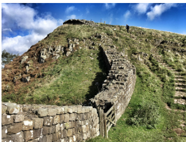
Hadrians Wall (England)

Aufgabe 4a: Das Römische Reich hatte viele Grenzen, die bewacht werden mussten. Schau dir dazu auf Seite 1 die Karte mit der lila Färbung an. Dabei gab es natürliche und bauliche Grenzen des Reiches. Ordne die Grenzarten mit Linien zu.