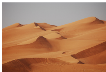
Wüsten (z.B. in Syrien)